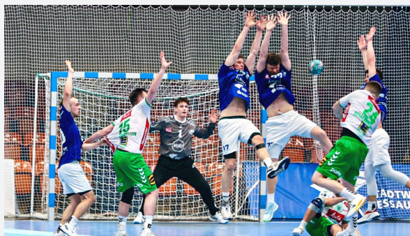
Auf eine starke DRHV-Defensive wird es beim Derby gegen Dresden wieder ankommen.